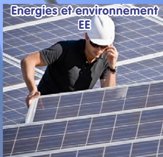
Energies et environnement EE