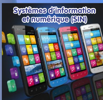
Systèmes d'information et numérique (SIN)