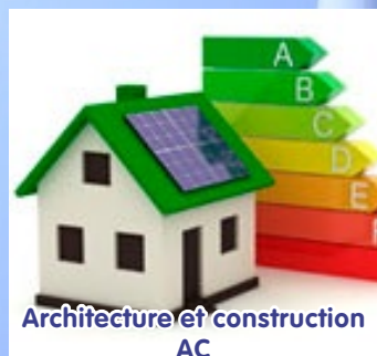
Architecture et construction AC