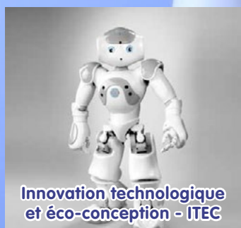
Innovation technologique et éco-conception - ITEC